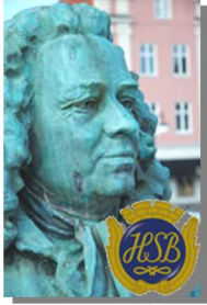
Brf Alströmer Alingsås