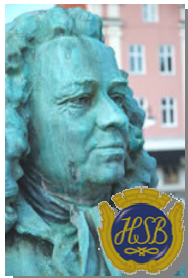
Brf Alströmer Alingsås