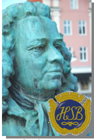
Brf Alströmer Alingsås