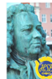
Brf Alströmer Alingsås