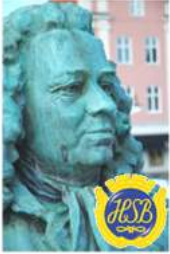
Brf Alströmer Alingsås