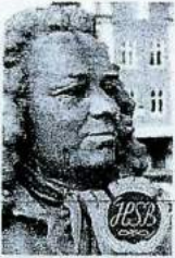
Brf Alströmer Alingsås