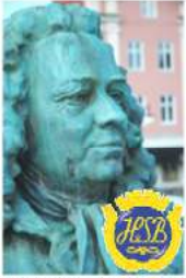
Brf Alströmer Alingsås