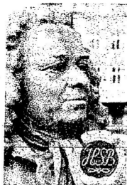
Brf Alströmer Alingsås