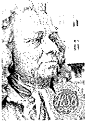
Brf Alströmer Alingsås

Du kan även skriva en motion på en vanlig lapp adresserad till Styrelsen Brf Alströmer med överskriften Motion .