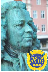
Brf Alströmer Alingsås

Du kan även skriva en motion på en vanlig lapp adresserad till Styrelsen Brf Alströmer med överskriften Motion.