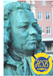
Brf Alströmer Alingsås