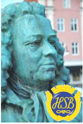
Brf Alströmer Alingsås

Du kan även skriva en motion på en vanlig lapp adresserad till Styrelsen Brf Alströmer med överskriften Motion.