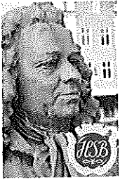
Brf Alströmer Alingsås

Du kan även skriva en motion på en vanlig lapp adresserad till Styrelsen Brf Alströmer med överskriften Motion.