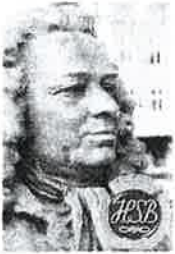
Brf Alströmer Alingsås

Du kan även skriva en motion på en vanlig lapp adresserad till Styrelsen Brf Alströmer med överskriften Motion.