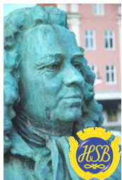
Brf Alströmer Alingsås

Du kan även skriva en motion på en vanlig lapp adresserad till Styrelsen Brf Alströmer med överskriften Motion .