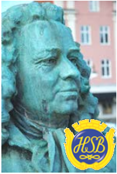
Brf Alströmer Alingsås

Till medlemmarna/delägarna i Brf Alströmer inför föreningsstämman torsdagen den 2 maj