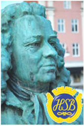
Brf Alströmer Alingsås