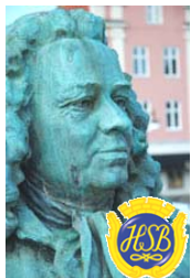
Brf Alströmer Alingsås