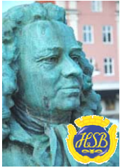
Brf Alströmer Alingsås